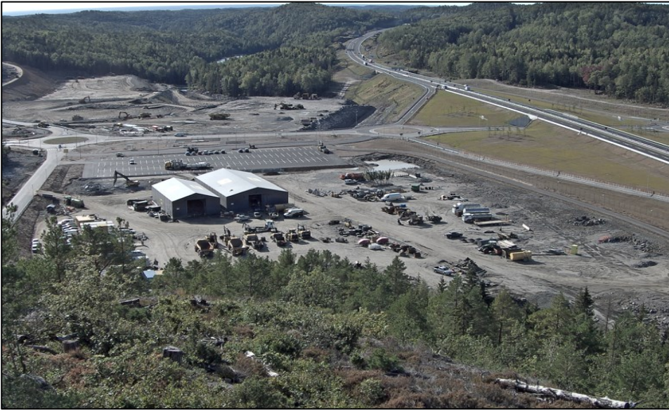
Bilde 1: Dagens situasjon per 17.09.2019 sett nordfra. Fra høyre: E18, påkjøringsrampe til E18 fra rundkjøringen, støyskjerm, gang- og sykkelvei,