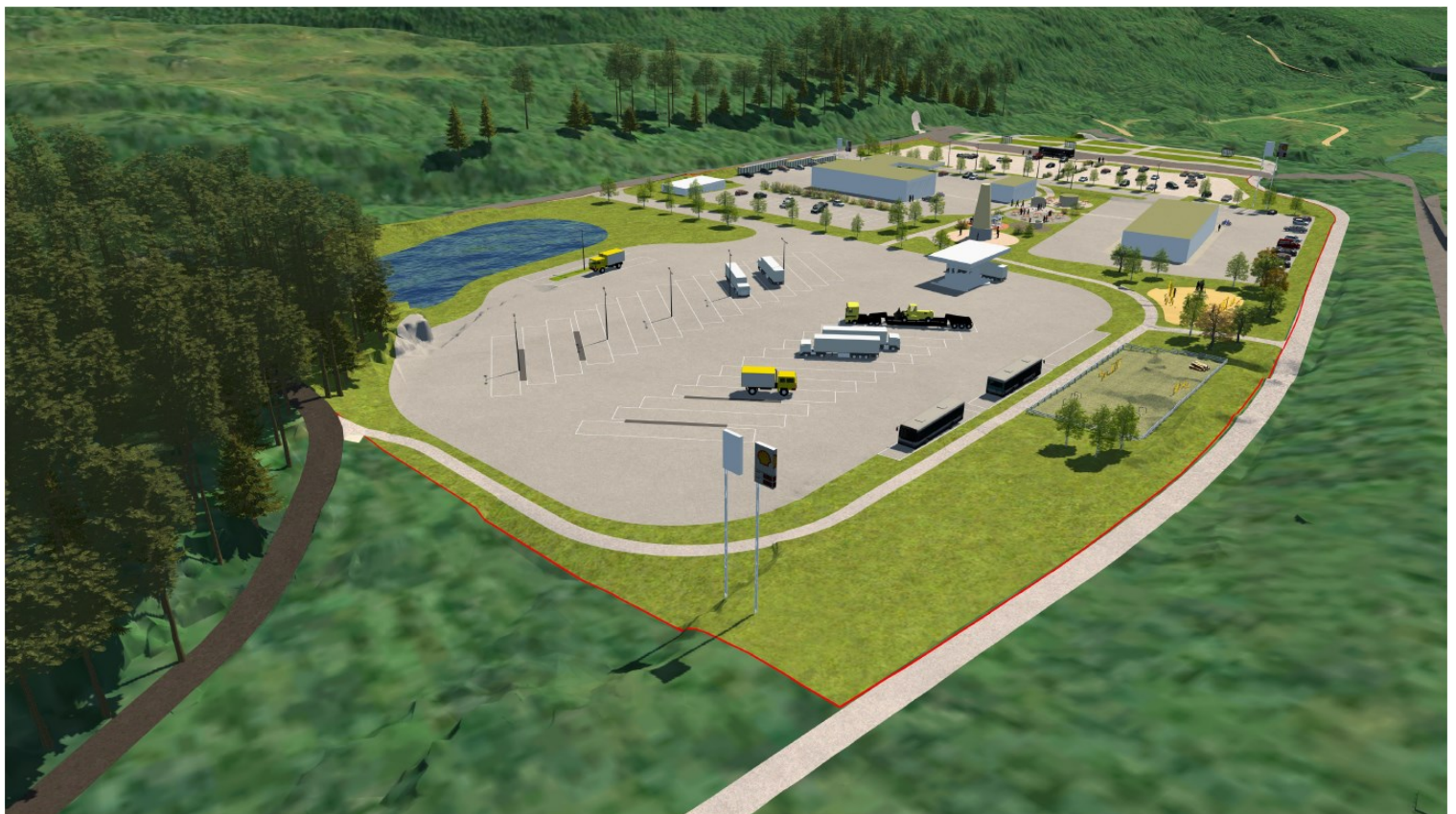
Vegserviceanlegget sett fra nord.